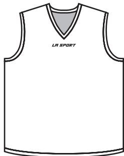
BB-01-R Régulière Regular