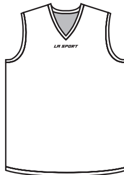
BB-01-T Longue Tall