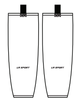
IH-S Bas / Socks 20", 22", 24", 26", 28", 30", 32"