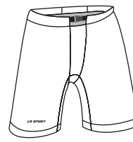
IH-P Gaine PRO PRO Pants Shells