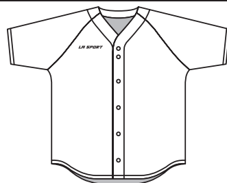
BA-02L 6 boutons - Léger 6 Button Lightweight Unisex / Unisex