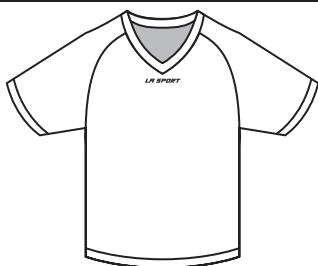
BA-01 Manches courtes Short Sleeves