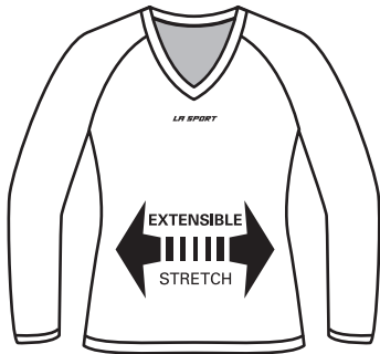
CH-01 Manches Longues Long Sleeves Adulte / Adult