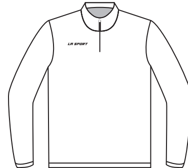
RW-01L Adulte / Adult Unisex / Unisex

1 à 11 unités : 25 % surcharge Prix augmenté de 10 % pour les grandeurs 3XL et plus. 1 to 11 units: 25% overcharge Pricing raised by 10% for sizes 3XL and over.